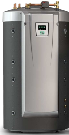
CTC EcoZenith i555 Pro * Basic