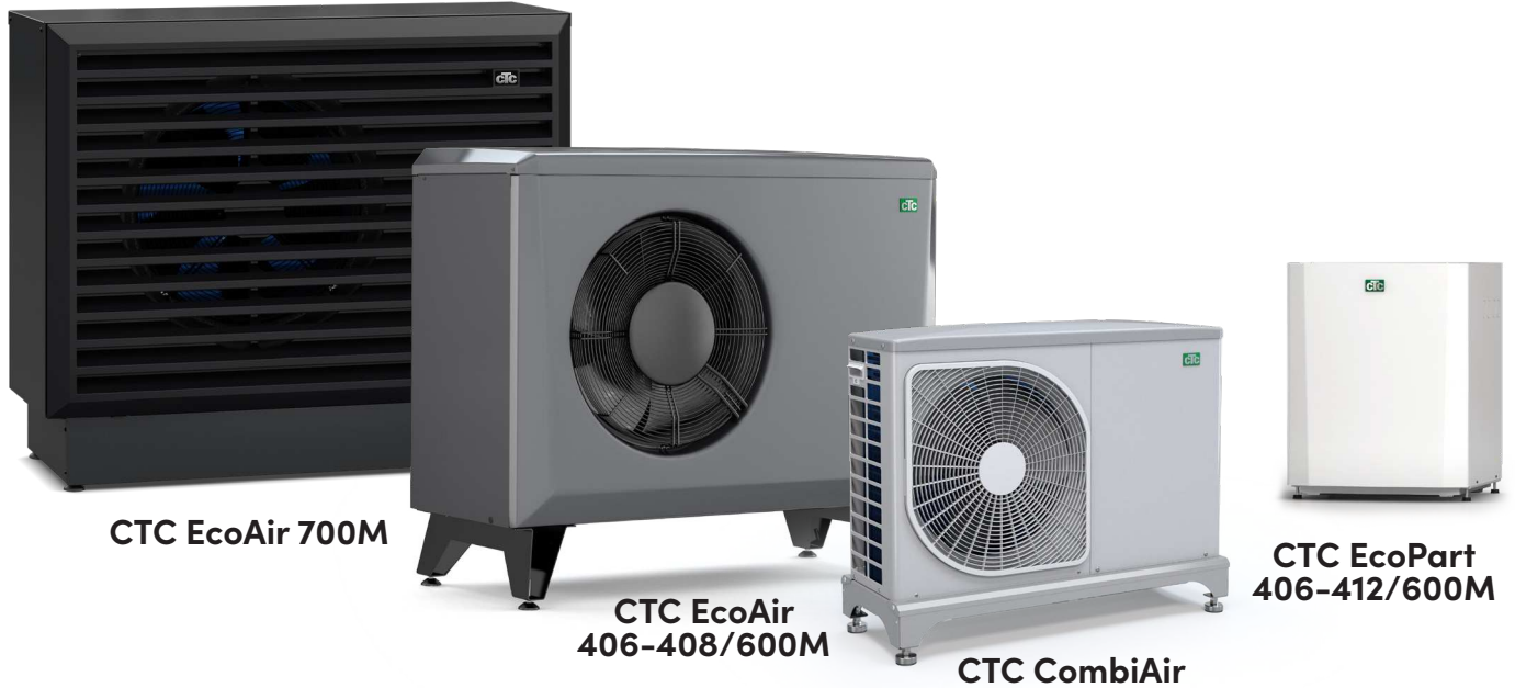
CTC EcoAir 700M

– lisätietoja on pumppujen tuote-esitteissä.