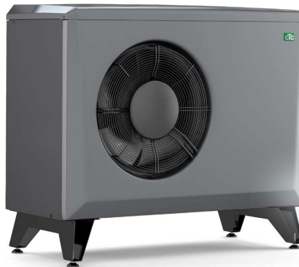
CTC EcoAir 406-408, 510M-622M