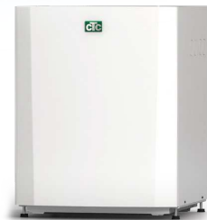
CTC EcoPart 406-412, 612M-616M