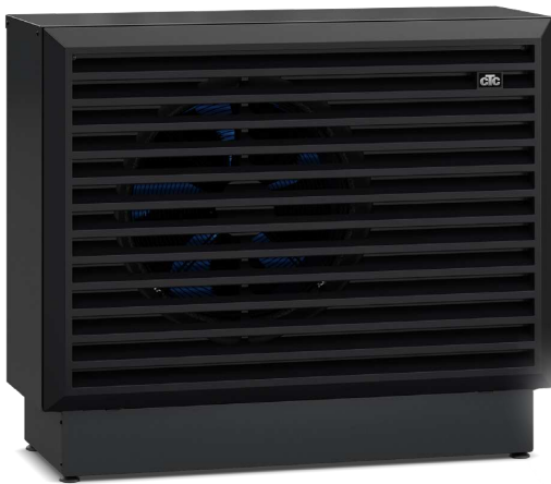
CTC EcoAir 700M

– ausführliche Informationen im entsprechenden Produktdatenblatt.