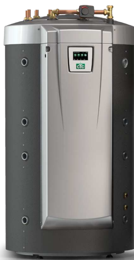
CTC EcoZenith i555 Pro * Basic