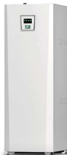
CTC EcoPart 400 Pro * Basic