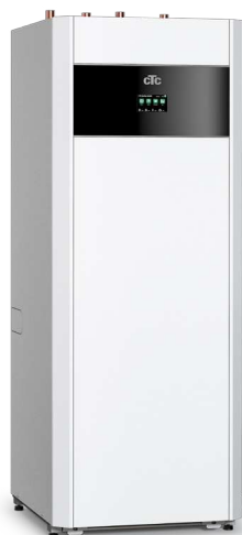
CTC EcoPart i600M * Basic