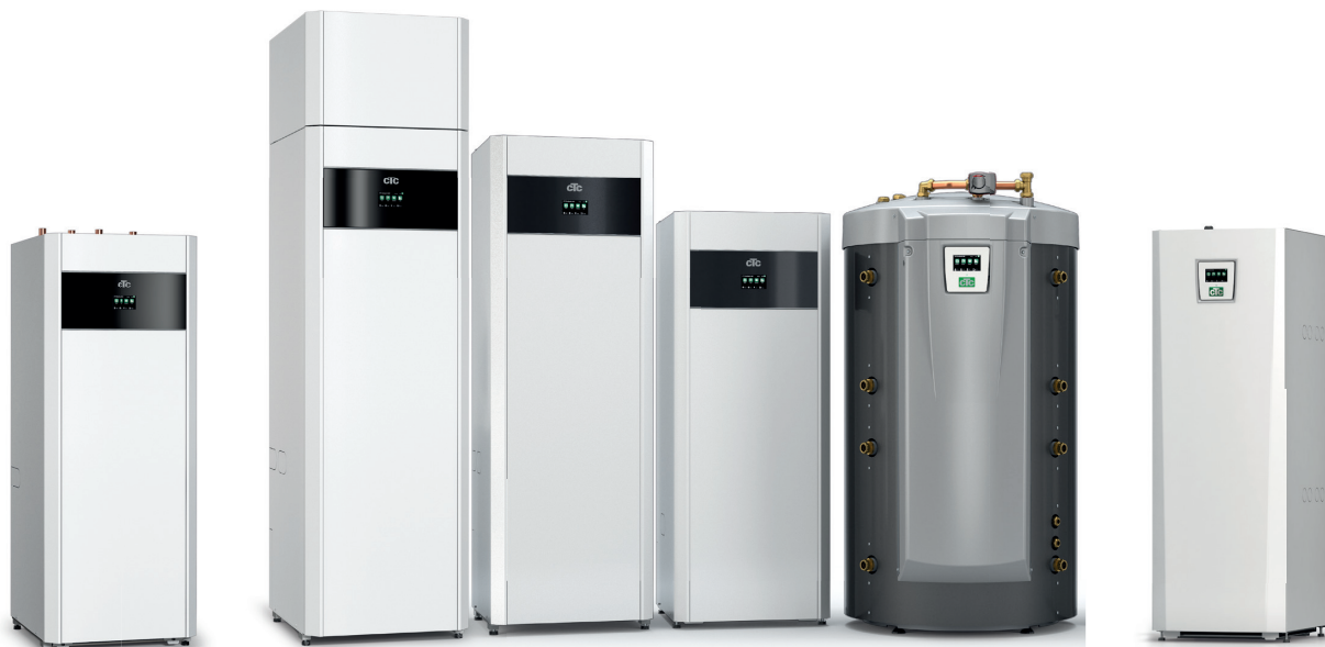
CTC EcoPart i600M

– kijk voor meer informatie op de respectievelijke productfiches.