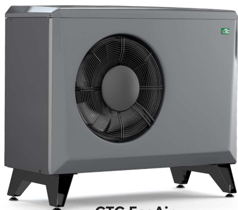
CTC EcoAir 406-408/600M

– pour des informations plus détaillées, voir leur fiche technique.