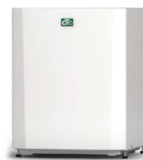
CTC EcoPart 406-412/600M